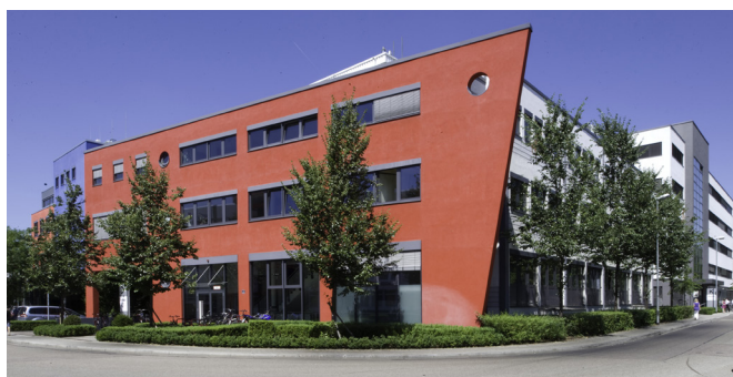
Zentrale der Media-Saturn-Holding in Ingolstadt

ver.di protestiert nachdrücklich gegen die Kahl-schlagpläne. Die Konzernführung darf die Pandemie und den Online-Boom nicht als Vorwände nutzen, um eigene Versäumnisse zu kaschieren.